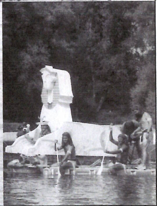
La Descente du Rhône en Sanitaires : la manifestation la plus délirante de l'ASCUL !

Le présent document a été mis en page et rédigé par Jocelyn Blanc, chargé de communication à l'ASCUL durant la période du 1er Février au 31 Juillet 1995.