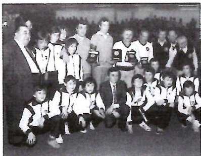
Trophée Béraudier- 1984