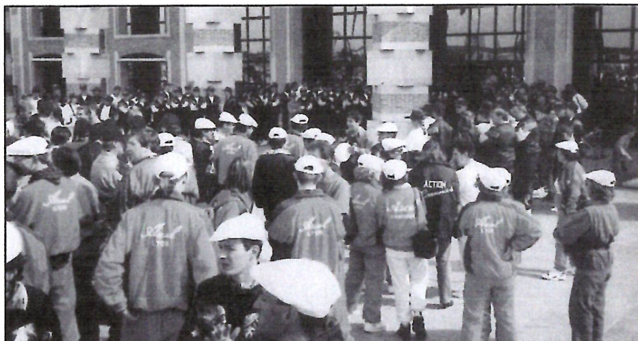
Les sportifs communautaires au tournoi de Dunkerque - 29 Mai 1993