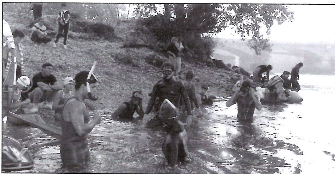
Les concurrents au départ du 2ème Palmathlon