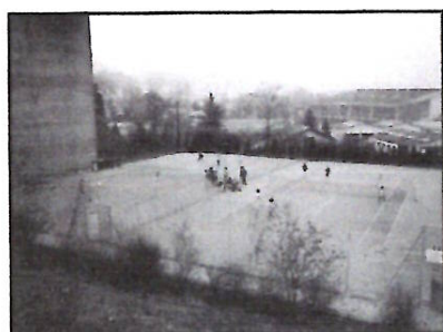
Le site des Deux-Amants